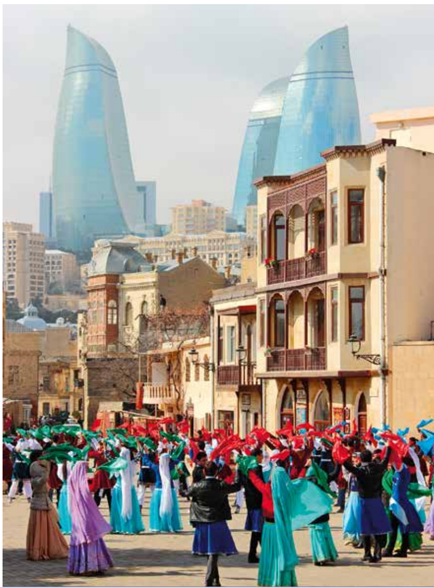
W Baku organizowane są festiwale ludowych zespołów pieśni i tańca

W odpowiedzi na rosnące zainteresowanie ekoturystyką w Azerbejdżanie aktywnie rozwija się birdwatching. Destynacja odnotowała około 400 gatunków ptaków i może pochwalić się niewielkimi odległościami między miejscami obserwacji ptaków. Podkreśla to wartość zrozumienia korzyści płynących z lokalnych zasobów i tego, o ile więcej społeczność może zyskać dzięki odpowiedniej ochronie. Praktyka obserwacji ptaków dodatkowo pokazuje wyjątkowość krajobrazów i siedlisk. Azerbejdżan oferuje bogactwo wspaniałych miejsc do obserwacji ptaków, z których każde zapewnia niesamowite przygody. Na przykład Park Narodowy Gizil Aghaj oferuje fantastyczny pokaz obserwacji ptaków, który odbywa się przez cały rok. Nachczywan oferuje również gatunki niespotykane nigdzie indziej w Azerbejdżanie, a Beshbarmag obserwuje codzienne przeloty do 200 tys. ptaków w sezonie migracyjnym.