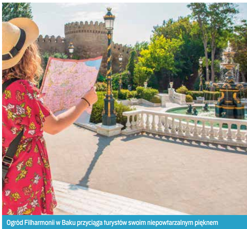
Ogród Filharmonii w Baku przyciąga turystów swoim niepowtarzalnym pięknem

Witamy w ekscytującej podróży do krainy oszałamiających krajobrazów i bogatej kultury, podczas której zagłębimy się w potencjał turystyczny Azerbejdżanu.