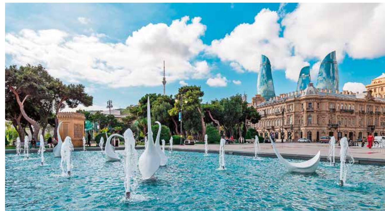
Baku szczyci się urokliwymi fontannami, ponadto miasto łączy w sobie tradycję z nowoczesnością: zza kamienicy widać tzw. Wieże Ogniste

Na obrzeżach Baku odwiedzający mogą poznać prehistoryczne społeczeństwo ludzkie we wpisanym na listę UNESCO Państwowym Rezerwacie Historyczno-Kulturowym Gobustan,