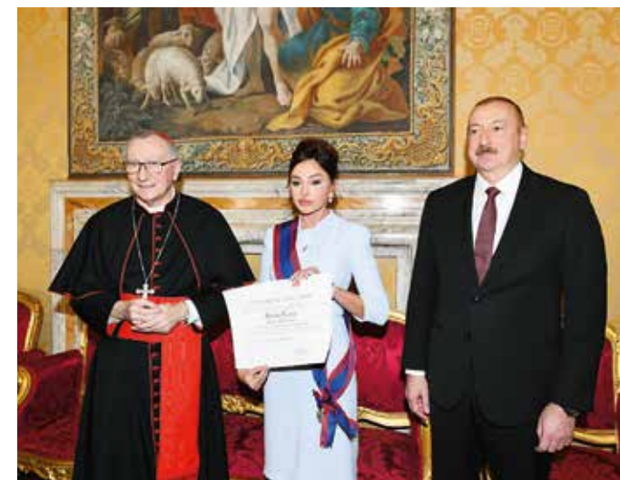
Pierwsza wiceprezydent Azerbejdżanu Mehriban Alijewa w 2021 r. otrzymała Krzyż Wielki Orderu Piusa IX

ogromną wagę do projektów renowacyjnych oraz udziału w ceremoniach otwarcia. W ramach oficjalnej wizyty delegacji prezydenta Azerbejdżanu pana İlhama Alijewa w Watykanie pani Mehriban Alijewa osobiście spotkała się z papieżem Franciszkiem. Zapoznana się również z procesem restauracji zabytków i osobiście sprawdziła postępy prac.