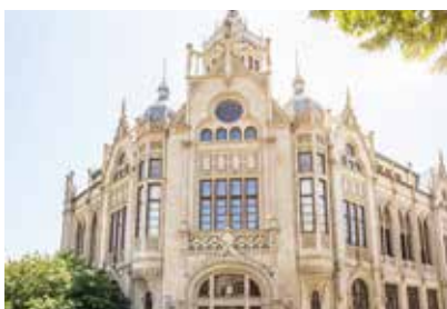
Pałac Szczęścia w Baku