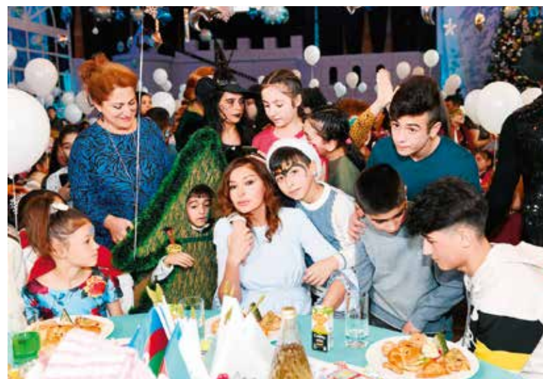
Prezes fundacji Mehriban Alijewa w otoczeniu dzieci

Fundacja im. Hejdara Alijewa przywiązuje zatem szczególną wagę do renowacji i odbudowy azerbejdżańskich meczetów, kościołów i synagog. Przykładami obiektów objętych takimi pracami są: Prawosławne Centrum Religijno-Kulturowe Eparchii Bakijskiej, Kościół Rzymskokatolicki i Synagogi Żydów Aszkenazyjskich oraz Górskich, a także