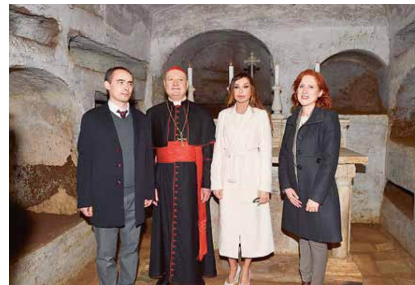
Inauguracja odrestaurowanych katakumb św. Marcelina i Piotra w Watykanie, 2016 r.

Prezes Fundacji im. Hejdara Alijewa, pierwsza wiceprezydent Azerbejdżanu pani Mehriban Alijewa osobiście przywiązuje