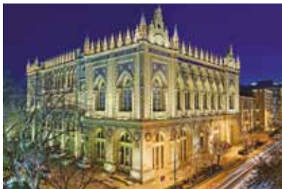
Prezydium Akademii Nauk w Baku

Polska i Azerbejdżan należały wtedy do carskiej Rosji. Wielu Polaków, skuszonych nowymi możliwościami oferowanymi przez szybko rozwijające się miasto, przyłączyło się do masowej emigracji ekonomicznej (z Rosji i innych państw) do Baku. Oprócz architektów do stolicy przybywali inżynierowie, naukowcy, akademicy, muzycy, lekarze i nauczyciele. Miasto było już domem wielu Polaków wysiedlonych na Kaukaz za udział w powstaniach przeciwko rosyjskiemu imperium. Polska spoleczność odegrała znaczną rolę w rozwoju przemysłu naftowego i innych obszarach. Jednak największy i najbardziej widoczny wpływ pozostawili po sobie w architekturze miasta. Polscy