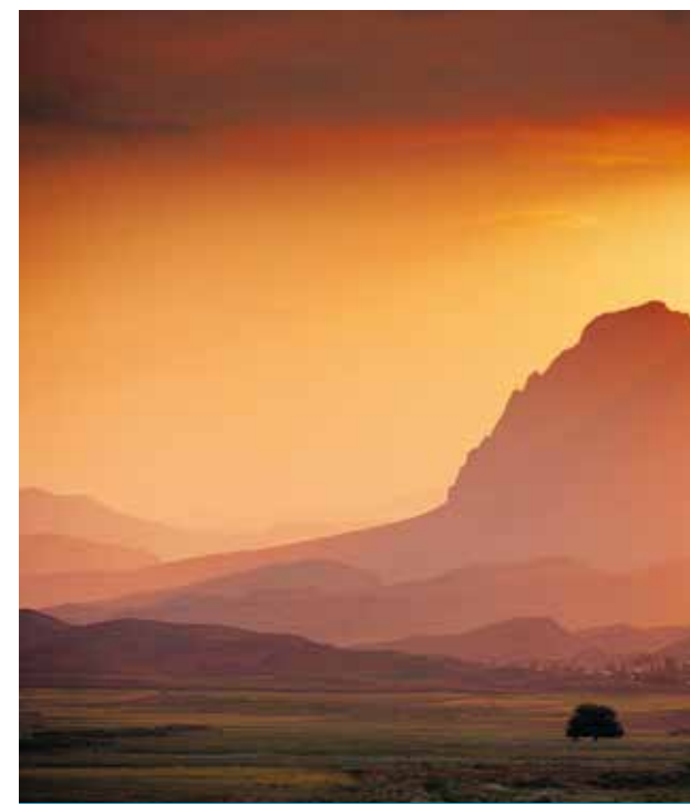
Piękno azerbejdżańskiego krajobrazu zachwyca turystów