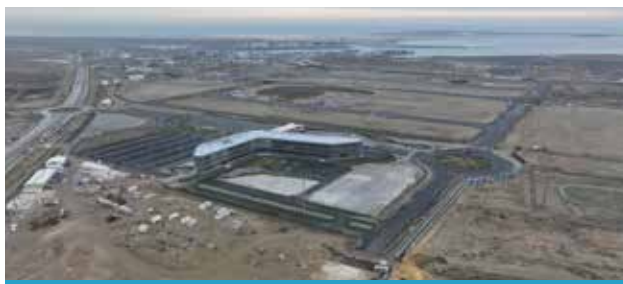
22 maja 2020 r. utworzono Wolną Strefę Ekonomiczną Alat (ang. Alat Free Economic Zone, AFEZ)

Podobnie jak w międzynarodowych strefach referencyjnych w AFEZ zarząd oferuje pakiet zachęt podatkowych i pozapodatkowych dla przedsiębiorstw założonych w Strefie. Są to m.in.: zwolnienie z VAT, podatku u źródła oraz innych podatków dla osób prawnych, z opłat celnych i podatków od importu do Wolnej Strefy Ekonomicznej oraz eksportu z Wolnej Strefy, całkowite zniesienie ograniczeń dotyczących walut obcych i repatriacji zy-