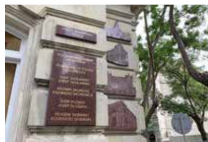
Ulica Polskich Architektów w Baku

architekci zaprojektowali przykuwające wzrok rezydencje i pałace dla elity naftowej Baku. Ich dziełem są również pełne przepychu budynki użyteczności publicznej i katedry. Wybitne projekty czerpały z najlepszych rozwiązań architektury lokalnej i zachodniej. Ponad wiek później pozostają wizytówkami Baku.