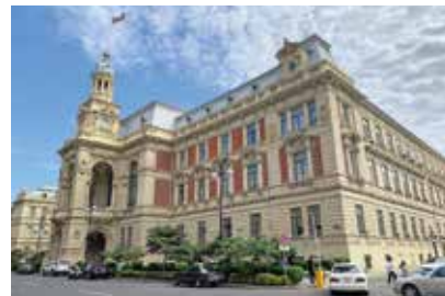
Budynek Rady Miejskiej w Baku